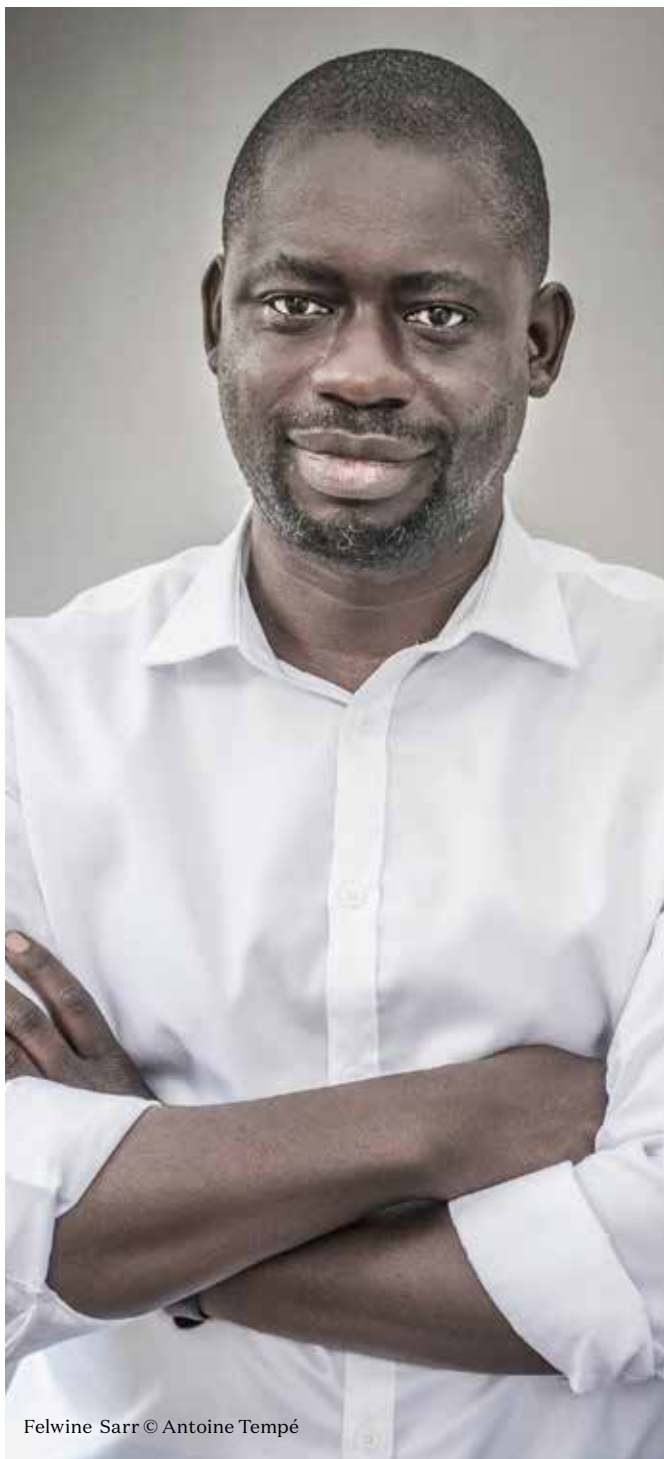
Felwine Sarr