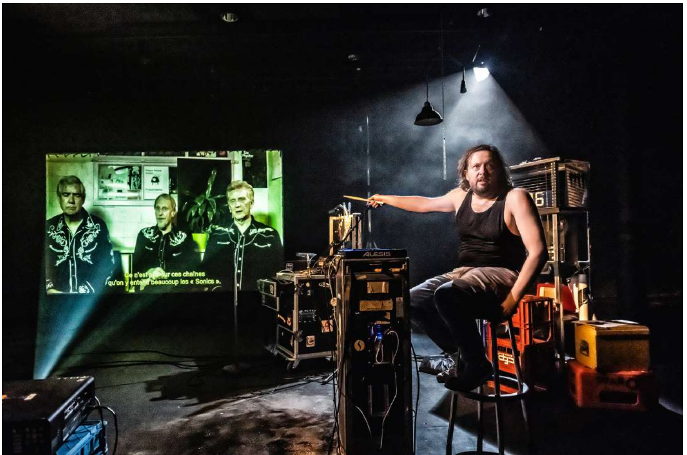
Tacoma Garage

Un peu éméché, en fin de gig, Corentin contacte par e-mail le management du groupe en demandant l'autorisation pour réaliser un film sur les routes d'Europe sur les riffs de The Witch et autres chansons emblématiques de la formation. Conscient de son audace, il n'en revient pas quand l'autorisation lui est donnée. Le hic: il n'a jamais filmé quoique ce soit... N'écoutant que son courage, l'acteur file sur une autoroute allemande en destination de retrouvailles étonnantes. De film, il n'y en aura sans doute jamais, au vu du résultat -disons-le- mitigé de la réalisation des images prises dans les coulisses et lors des concerts. Qu'importe, il en a fait un spectacle!